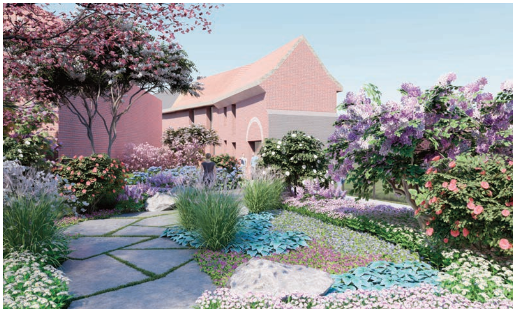
Vue du Jardin des Carmes depuis la Place du Hainaut

Les travaux comprendront la réfection complète des réseaux (eau potable, électricité, éclairage public et vidéosurveillance), la mise en conformité des réseaux d'assainissement, le pavage des rues du Four de la Paix et Badin, ainsi que la création du jardin des Carmes.