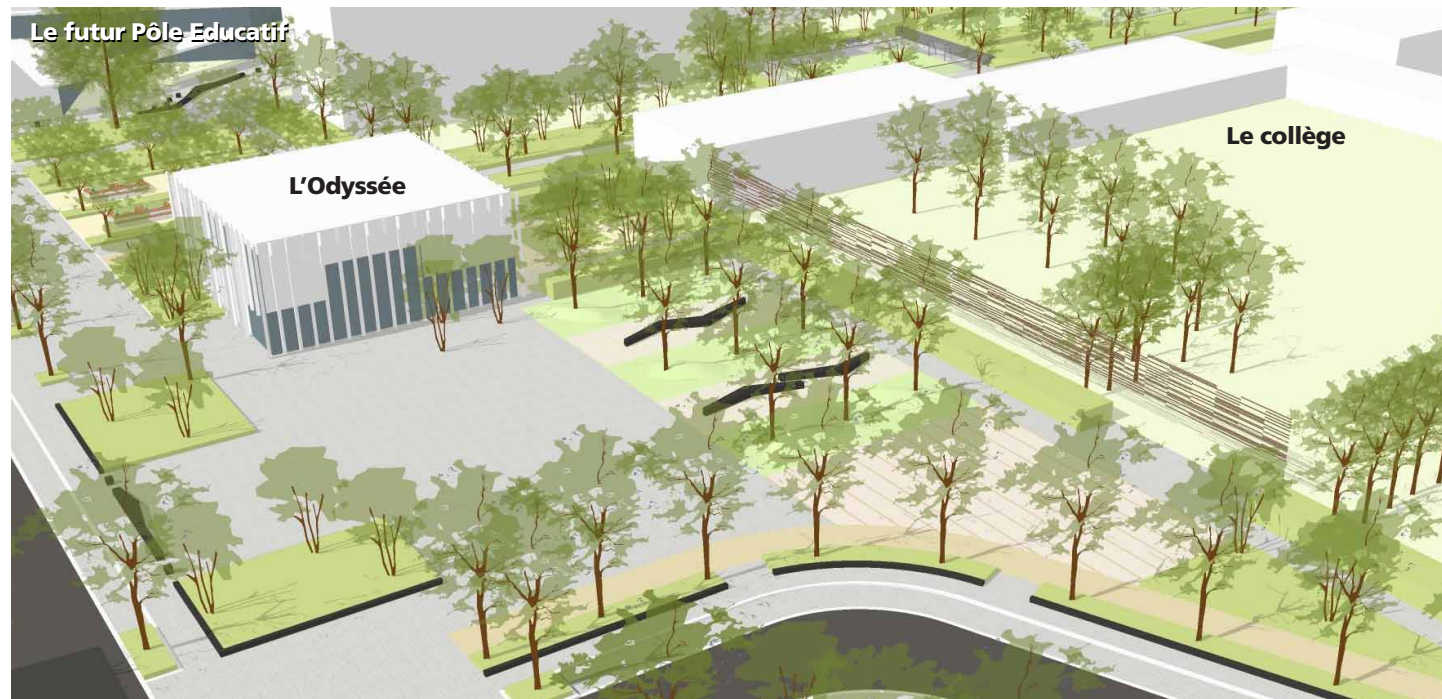
Vue sur le projet de la place de l'Odysée

Les travaux de rénovation du parvis de l'Odysée ont débuté en juin 2023. A termes, ce seront près de 45 arbres et 13 arbustes en cépées qui seront plantés entre l'Odysée et le nouveau Pôle éducatif. Des bancs y seront également installés pour profiter pleinement de ce nouvel espace de fraîcheur au sein du quartier.