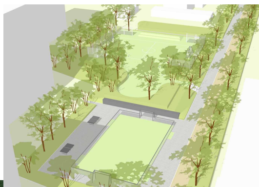
Vue sur le projet de l'allée du tram

En effet, dans le cadre des travaux de l'Entrée Nord, la passerelle piétonne qui surplombe l'autoroute et rejoint le quartier de Dutemple sera démolie et l'allée du tram sera connectée directement au futur boulevard puisqu'elle sera abaissée.