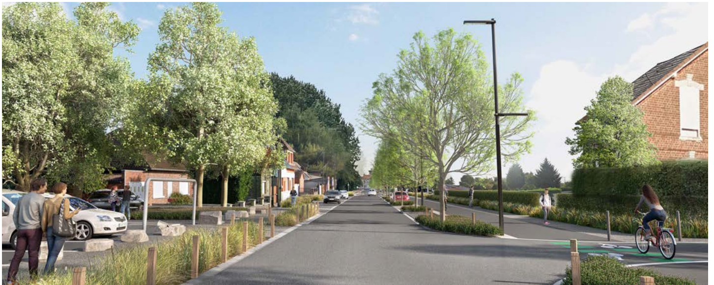
Chasse de Valenciennes à Onnaing.