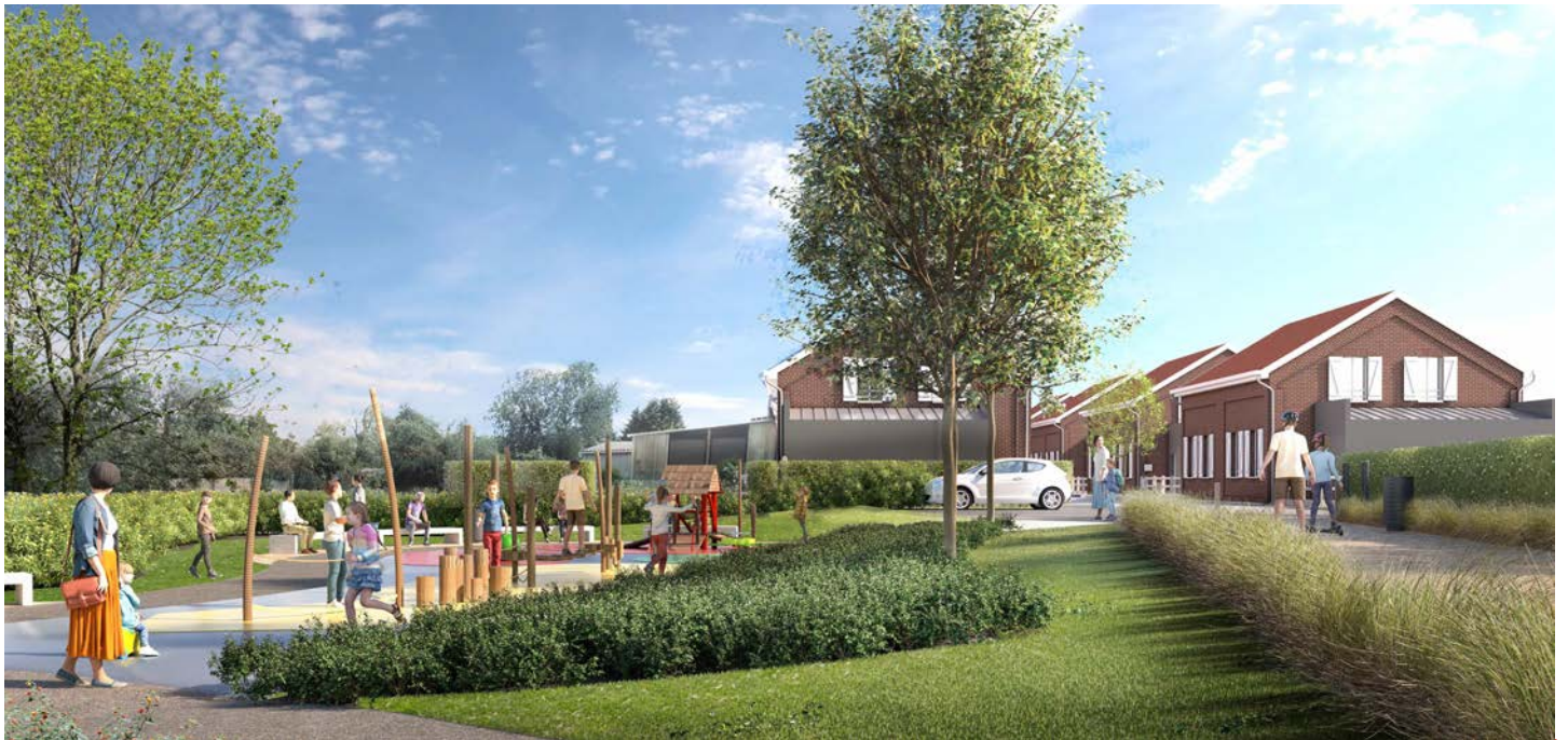
Espaces publics à Vicq.