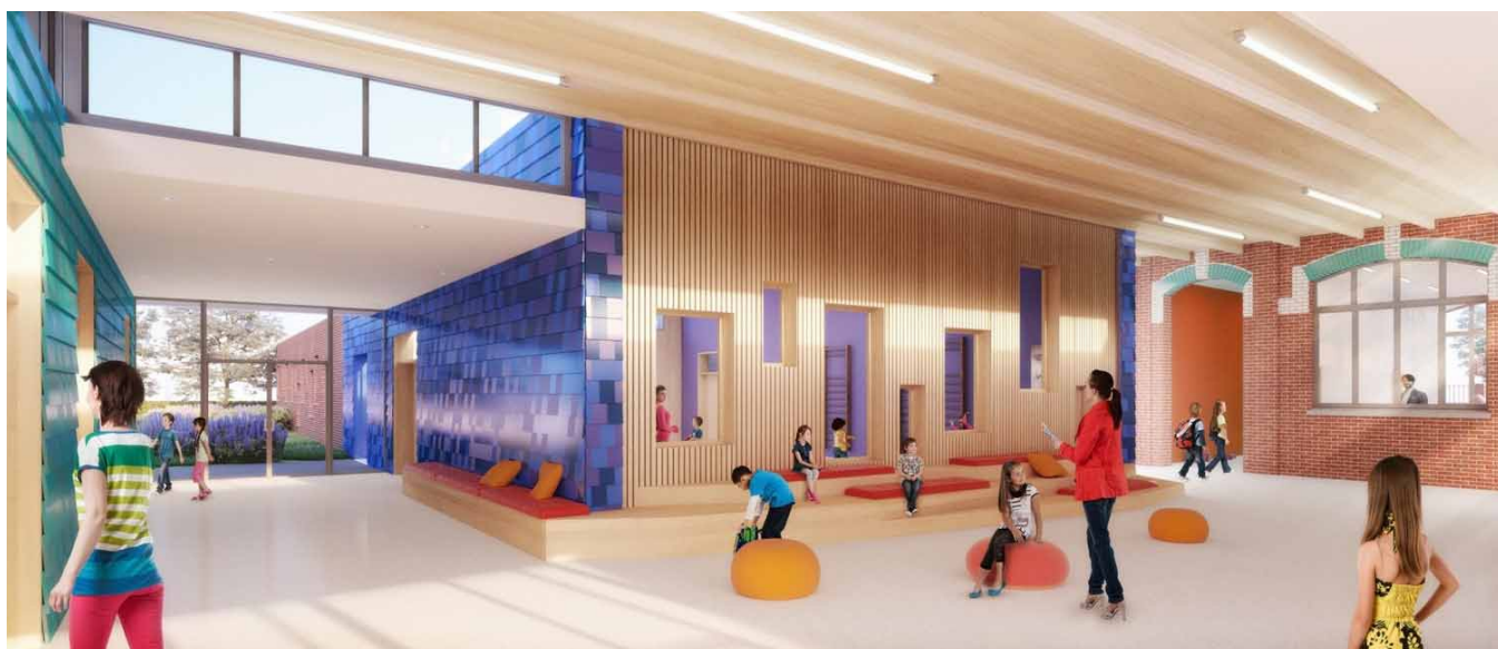
Futur groupe scolaire Cuvinot : des espaces partagés lumineux et colorés.