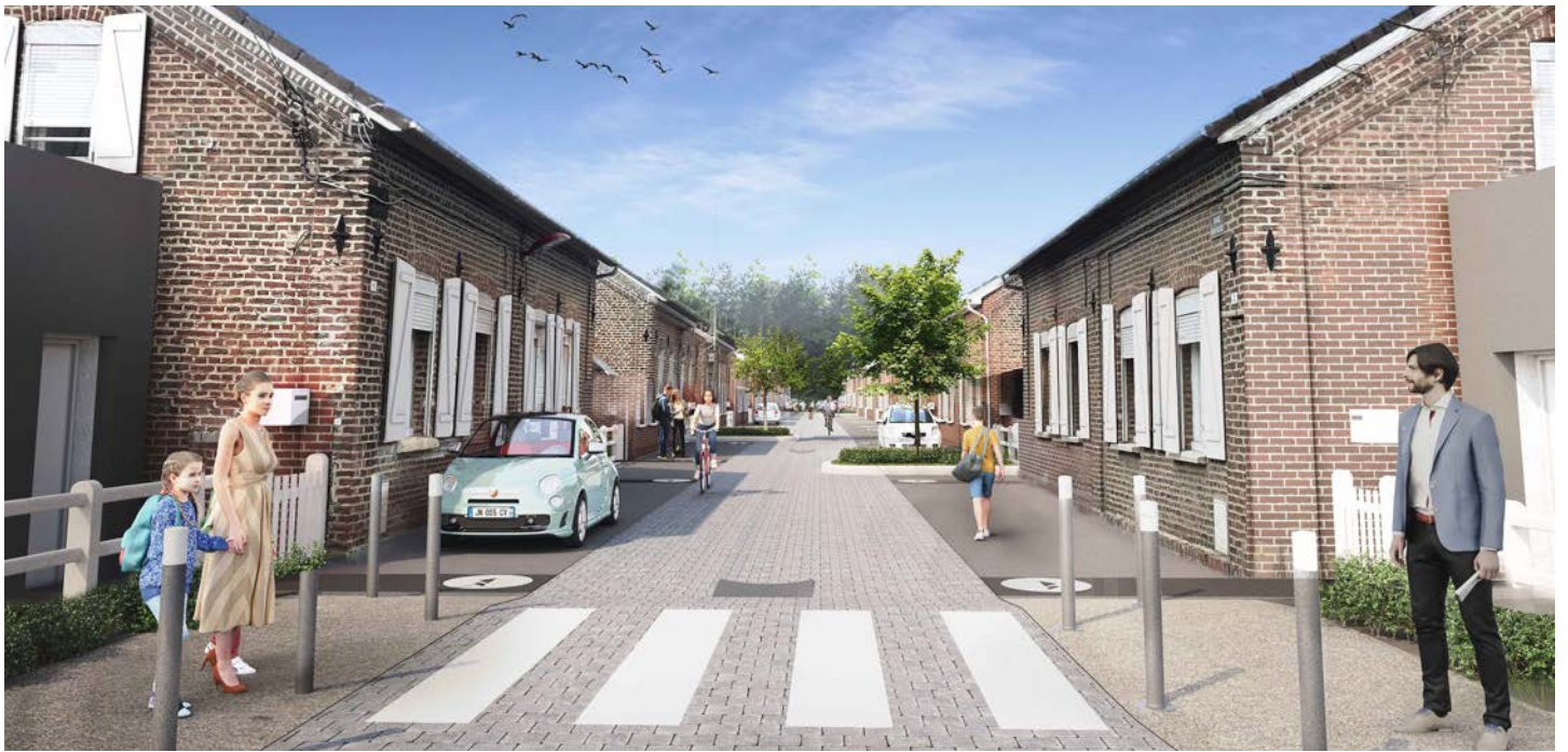
Rue Renard à Onnaing.