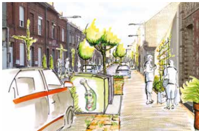
Perspective de la rue Benezeth après les travaux de réaménagement

Les rues Gambetta et Badar traversent le quartier du nord au sud. Elles sont suffisamment larges pour accueillir une voie verte de 3,5m à 4m permettant de favoriser et sécuriser les déplacements piétons et cyclistes. Pour assurer les continuités vélos, la rue Delsart et la rue Gambetta nord-est intégreront un double-sens cyclable .