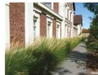
Une transition douce avec les logements de la cour Servais