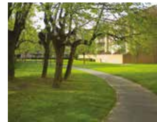
Des espaces de promenade, de loisirs et de fitness pour tous les âges