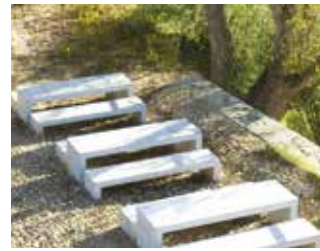
Une aire de pique nique surplombant le cirque