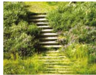
Des espaces en béton intégrés aux espaces verts