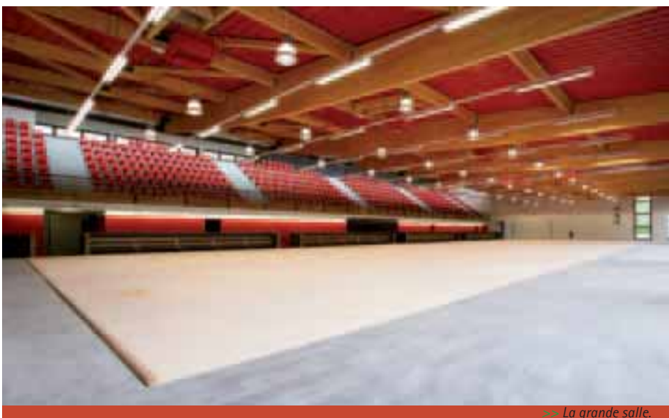
>> La grande salle.