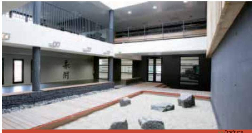
>> Esprit zen.