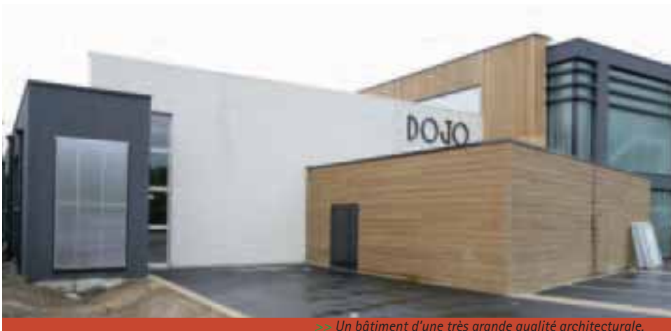
» Un bâtiment d'une très grande qualité architecturale.

Le dojo communautaire de Vieux-Condé est achevé. A la découverte d'un lieu aussi zen que fonctionnel.